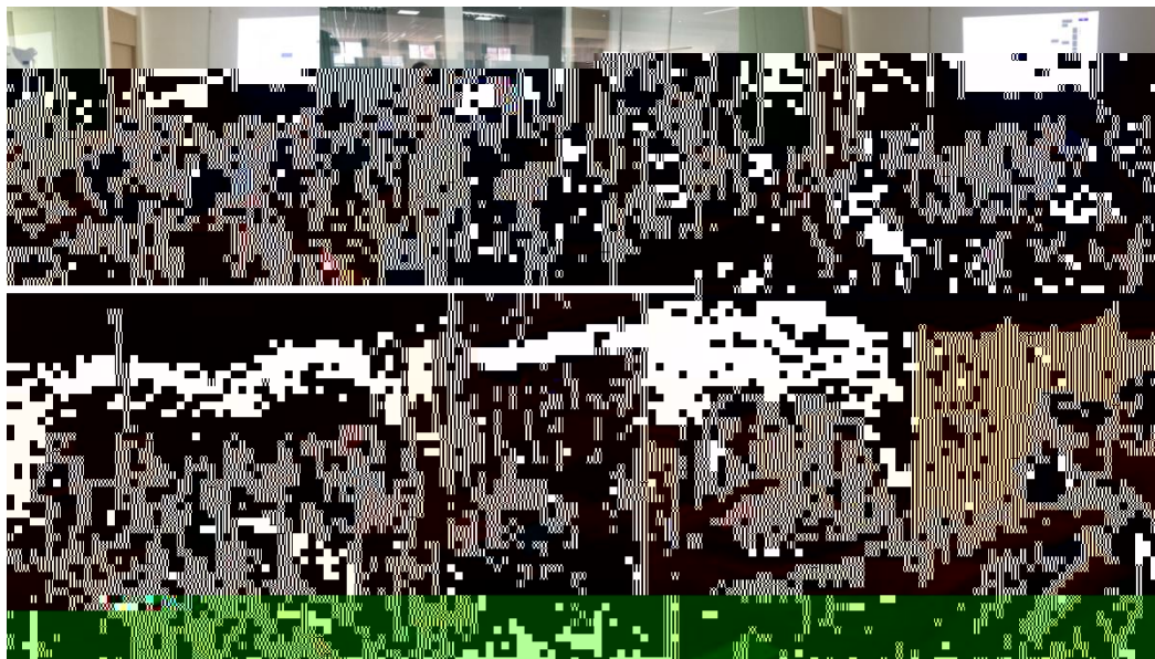
图 特邀企业专家来基地为学生进行专业培训

地 2023 地 ( 2), 供 宝贵的 。 过 的分 , 度 、 场变 , 对电 播 的 。 不 的 储备, 高 操 , 的 发 奠定 础。 措 合 的 度, 地 合 的 。